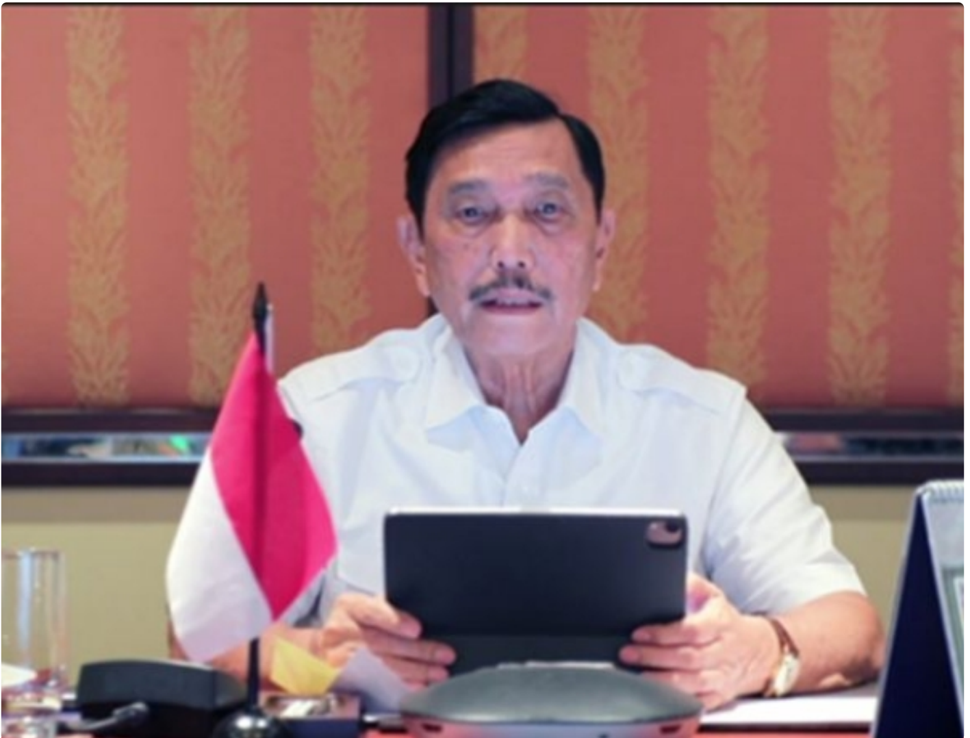
Menko Maritim dan Investasi Luhut Binsar Pandjaitan dalam sambutannya pada kegiatan seminar internasional ICoFMR

KOTA MALANG - Kegiatan seminar internasional Fakultas Perikanan dan Ilmu